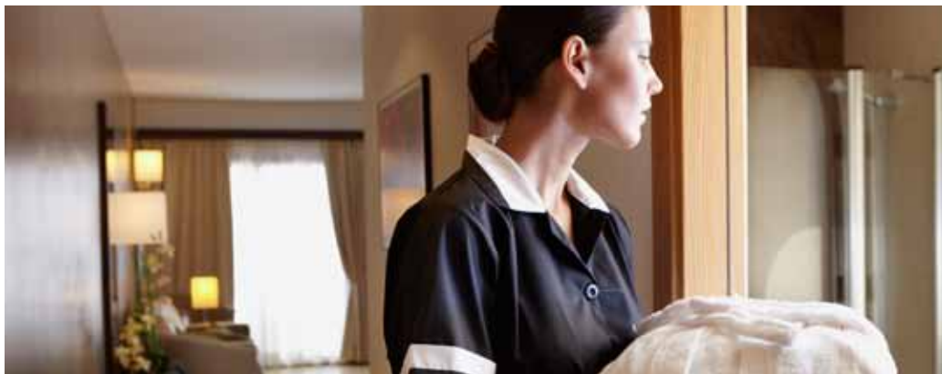
► Una filosofia del servizio dedicata esclusivamente agli hotel